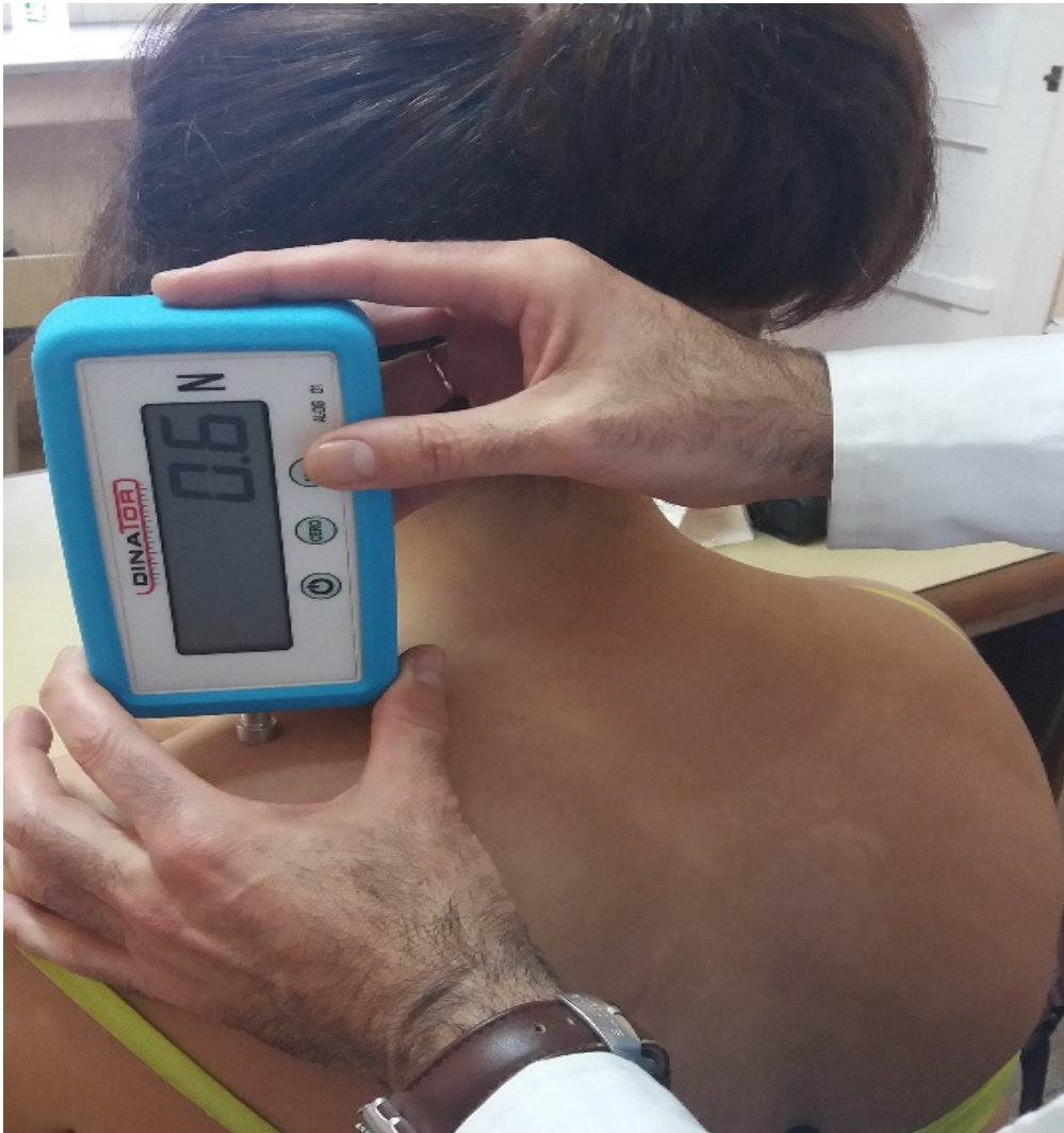
Figura 1. Aplicación de algometría de presión en el músculo trapecio.