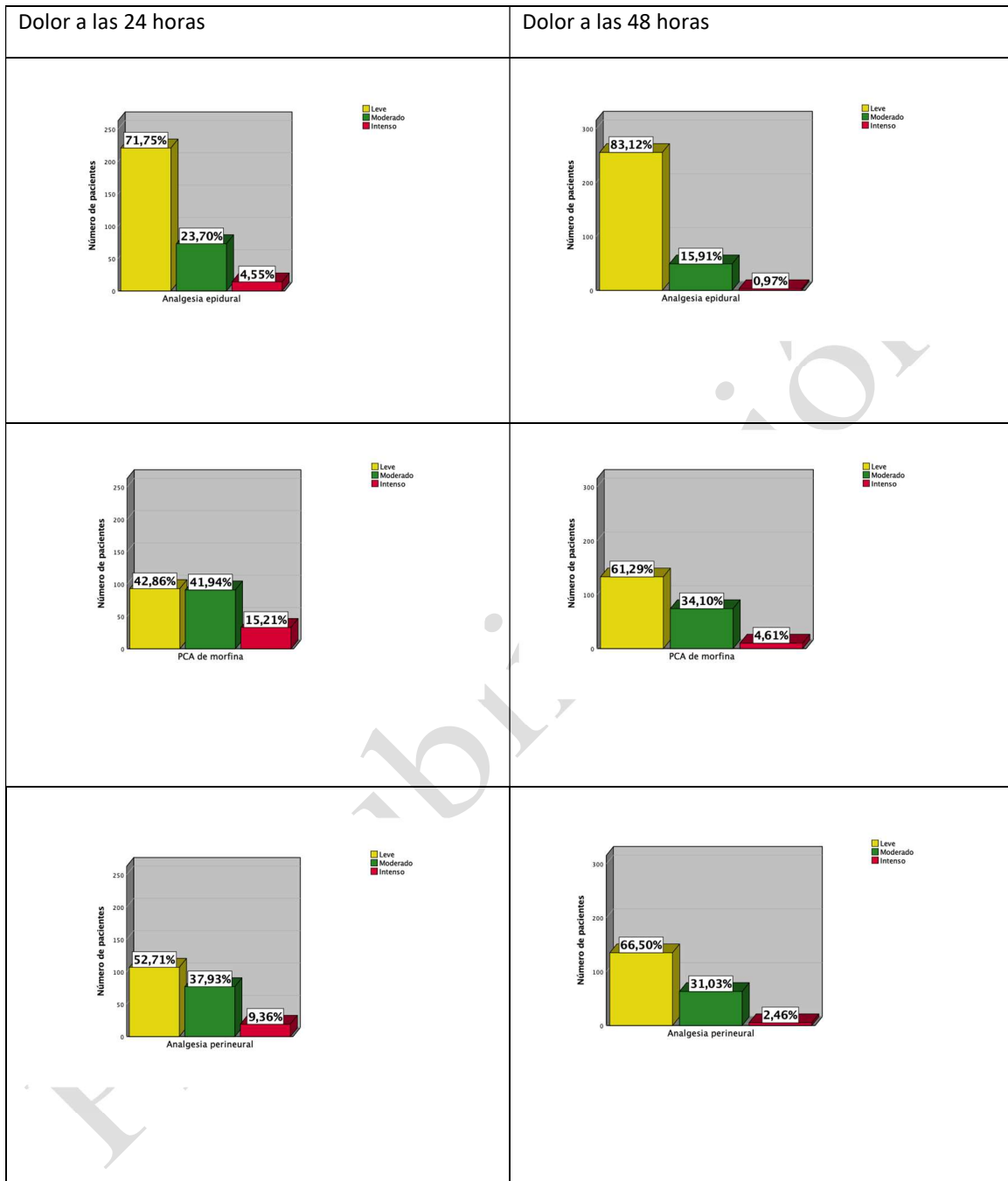
Figura 3. Dolor a las 24 y 48 horas para cada técnica.