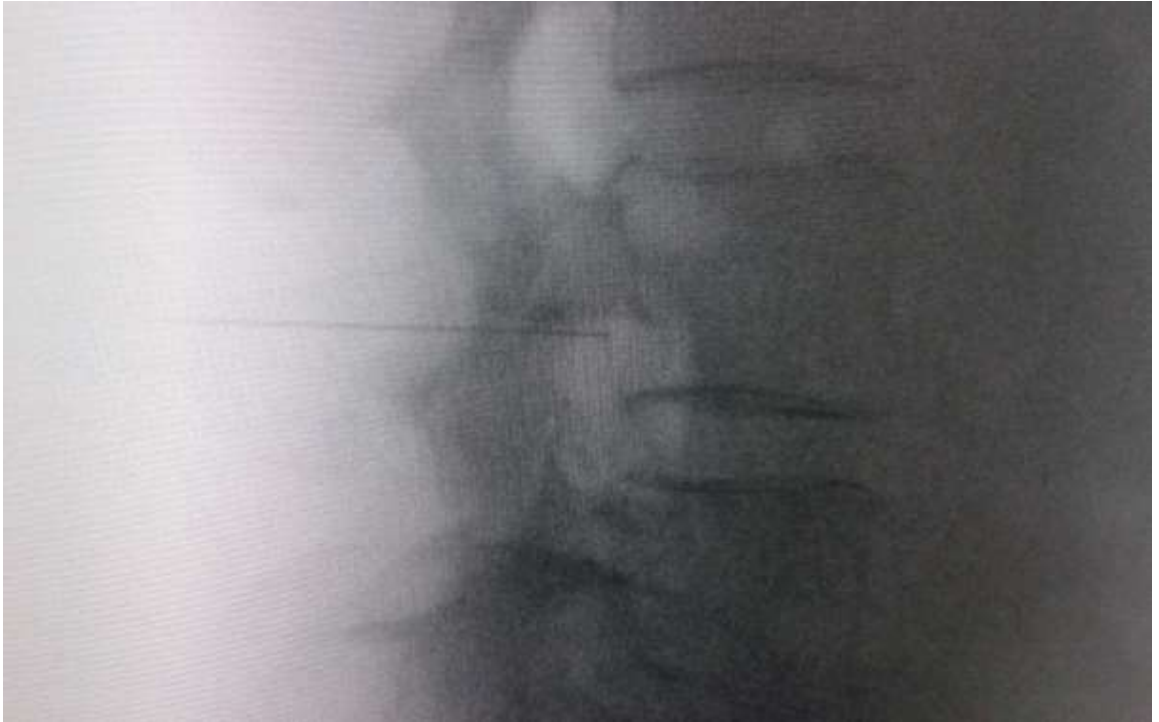
Figura 1. Vista radiológica de perfil que muestra una cánula de radiofrecuencia en el ángulo anterosuperior o techo del neuroforamen, topografía aproximada del ganglio de la raíz dorsal.