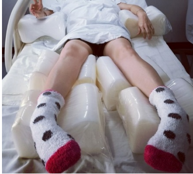
Figura 1. Paciente con secuelas de la enfermedad, rigidez en miembros pélvicos y postrada en cama con imposibilidad a la deambulación.