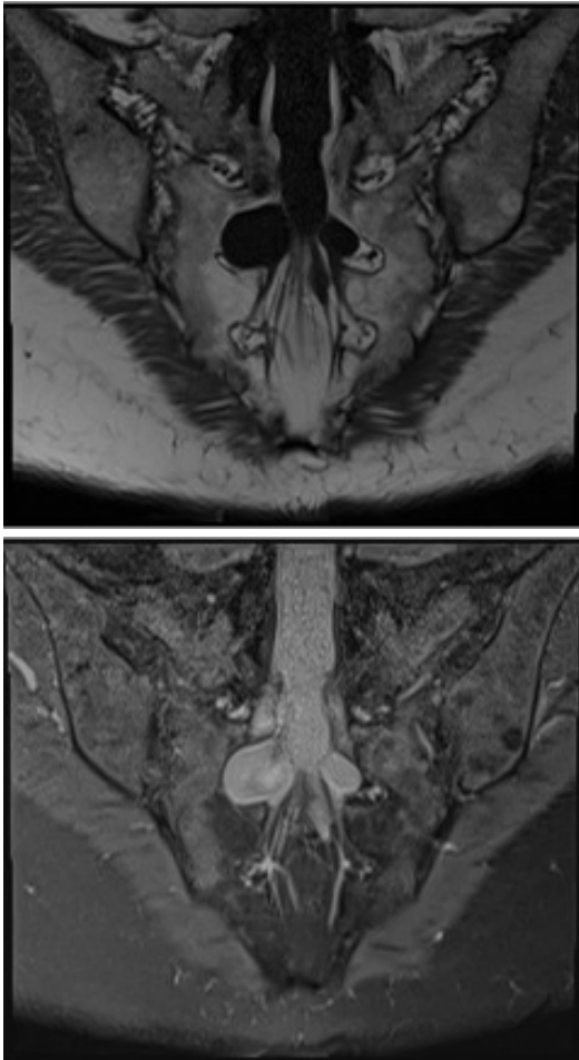
Figura 1. RMN de quistes de Tarlov, corte axial, señal T1 imagen superior, T2 imagen inferior; se pueden observar los tractos fistulosos hacia el canal raquídeo.