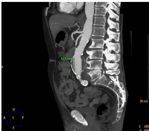
Fig. 1. TC coronal de aneurisma de aorta abdominal.

Se conoce como aneurisma arterial a aquella dilatación focal permanente superior al 50 % del diámetro normal de la arteria sana adyacente. Se trata de una entidad relativamente frecuente, presentándose entre el 2 y el 5 % de la población a nivel mundial. Su localización más habitual es a nivel de aorta infrarrenal (1).